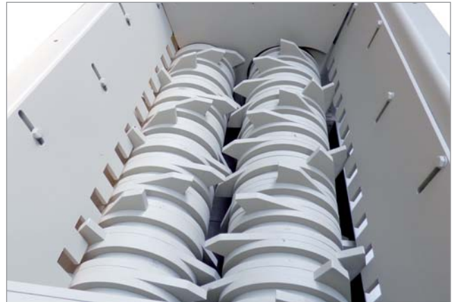
Einteilige Zahnscheiben eines WMH 416b