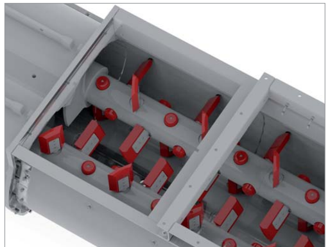
Blick in die Mischkammer - Mischmesser, gehärtete Schutzkappen und Wellenschutzhülsen