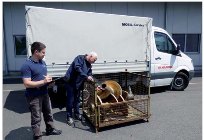
Mobil Service - Beurteilung direkt vor Ort