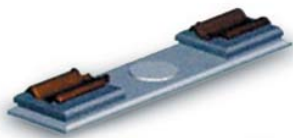
WEGA S II

Die Tischgröße beträgt 560 x 754 mm, was einer maximalen Aufspannfläche für die Formen von 500 x 650 mm entspricht. Die nutzbare Formenpakethöhe ist zwischen 170 und 300 mm einstellbar. Der Arbeitshub beträgt 300 mm, so dass praktisch alle vorkommenden Ziegelmodelle verpressbar sind. Der maximale Pressdruck von 1500 kN bzw. 2000 kN ermöglicht ein perfektes Auspressen auch bei komplizierten Modellen.