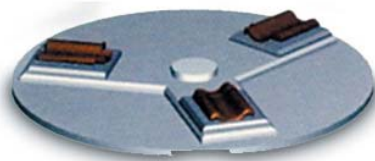
WEGA S III